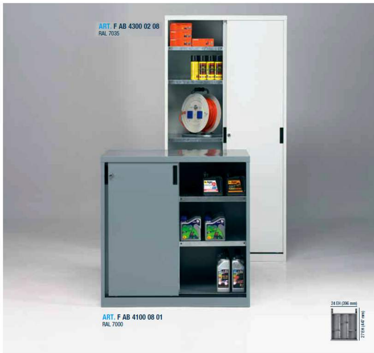
ART. F AB 4300 02 08 RAL 7035

LUNGHEZZA = 1023 mm PROFONDITÀ = 600 mm (24x27 Eh)